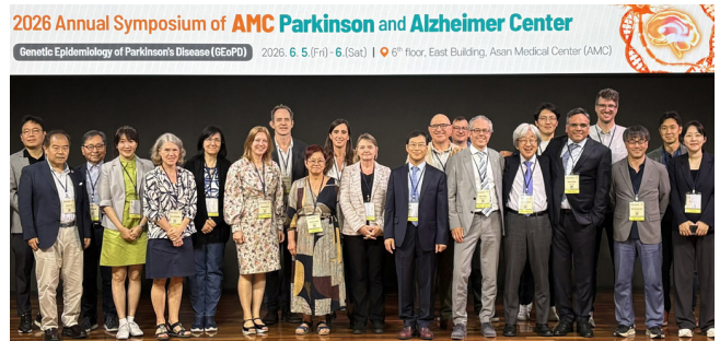
6월 5일 열린 파킨슨·알츠하이머센터 심포지엄 참석자들.

서울아산병원은 6월 5일부터 6일까지 이틀간 파킨슨·알츠하이머센터 심포지엄을 개최했다. 올해는 전 세계 6개 대륙, 60여 개의 연구 기관이 참여하는 글로벌 연구 네트워크 ‘파킨슨병 유전역학 국제 컨소시엄’과 함께 심포지엄을 개최해 학술적 깊이를 더했다. 연자로는 미국 메이요 클리닉의 팸 매클레인, 독일 뤼베크 의과대학의 크리스틴 클라인, 룩셈부르크 룩셈부르크대학교의 레이크 크루거, 프랑스 파리 제6대학교의 수잔 레사지 등 총 10개국 23명의 신경과 분야 세계적인 학자들이 참여해 파킨슨·알츠하이머 연구의 최신 흐름과 미래 전략을 조망했다.