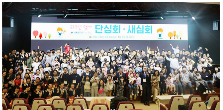
단심회·새심회 행사가 2025년 11월 15일 서울아산병원 동관 대강당에서 열렸다.