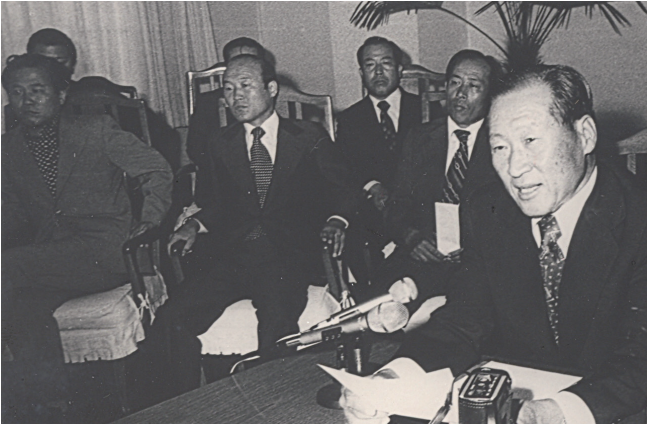
아산재단 창립 기자회견을 하고 있는 설립자(1977. 7. 1)